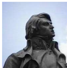
Ricaurte - Estatua en San Mateo

Con la entrada de Bolívar a Caracas, queda instituida una nueva república que controlaba todas las provincias menos Guayana y Maracaibo. Sin embargo, a la semana de haber llegado tuvo que volver a salir para luchar contra Monteverde, quien se había refugiado en Puerto Cabello. En septiembre, los realistas reciben refuerzos de España. Sin embargo, los éxitos militares de los patriotas continuaron durante 1813, con las batallas de Bárbula (aunque allí muere Girardot) y con la victoria sobre Monteverde en Las Trincheras, el 3 de octubre, forzando su salida del país.