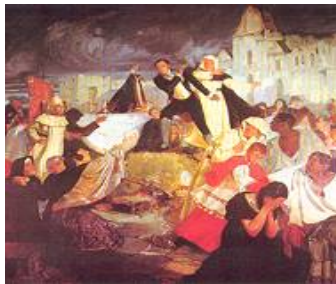
Terremoto de Caracas Tito Salas

de Venezuela, llamados los realistas, dominaban las provincias de Maracaibo, Guayana y Coro. España había ordenado el bloqueo a Venezuela, dificultando el comercio exterior, y organizó la resistencia bajo el mando del capitán Domingo Monteverde.