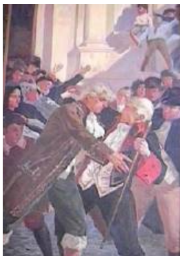
19 de Abril Fresco de Tito Salas

La independencia de Venezuela se inicia en Caracas, el 19 de Abril de 1810, cuando un grupo de criollos caraqueños aprovechó la excusa de que en España estaba mandando un francés, para convocar una reunión del cabildo y proclamar un gobierno propio hasta que Fernando VII volviera al trono de España.