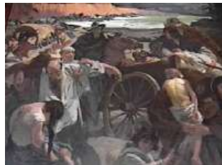
Detalle Huida hacia Oriente Titos Salas

Boves, sin embargo, logra reorganizar su ejército y emprende la marcha hacia Caracas. Bolívar lo detiene por algún tiempo en San Mateo, pero luego es vencido el 24 de marzo de 1814. Gracias a la acción heroica de Antonio Ricaurte, quien se sacrificó prendiéndole fuego al polvorín, la pólvora no cayó en manos de Boves.