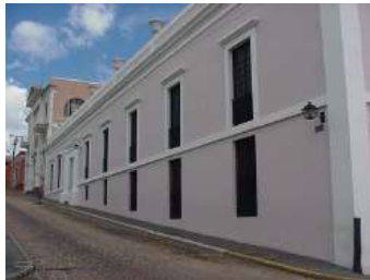
Casa donde se realizó el congreso de Angostura

El congreso convocado por Bolívar en 1818, se inicia el 15 de febrero de 1819. Su objetivo era darle una constitución a la república, ya que el libertador tenía poderes dictatoriales desde 1813.