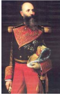
Antonio Guzmán Blanco

En lo social, se declara que la educación primaria debía ser gratuita y obligatoria. También se adopta el sistema métrico. Se unificó la moneda para facilitar el comercio, ya que en distintas regiones circulaban distintas monedas. Es en 1871 cuando se crea el "venezolano" o "peso fuerte" como moneda nacional, con una efigie de Bolívar por un lado y el escudo nacional por el otro, tal como hoy en día.