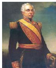
José Antonio Páez