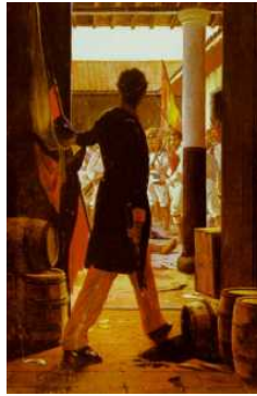
Ricaurte en San Mateo - Antonio Herrera

de un caudillo español realista, José Tomás Boves, quien con su liderazgo y la promesa de darles las riquezas de los blancos, comandó un poderoso ejército de llaneros pardos. Boves inicia sus victorias el 3 de febrero de 1814, derrotando a Vicente Campo Elías, en La Puerta. José Felix Ribas, quien contaba con muy pocos hombres, tuvo que salir a reclutar jóvenes estudiantes de la Universidad de Caracas y del Seminario para enfrentar a Boves.