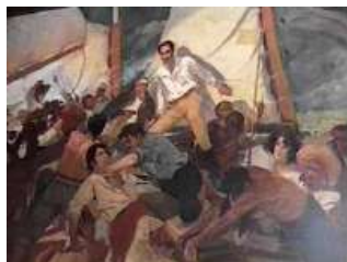
Expedición de Los Cayos - Tito Salas

Jamaica (Texto completo), el 6 de septiembre de 1815. En esta carta analiza la situación de todos los países hispanoamericanos y logra predecir, con bastante exactitud, lo que iba a pasar en cada una de estas naciones, demostrando su genialidad.