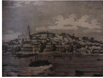
Angostura y el río Orinoco

El general realista La Torre se enfrenta a los patriotas, pero es derrotado el 11 de abril de 1817 en la batalla de San Félix. Simón Bolívar, con la división del general Bermúdez persigue a La Torre y lo obliga a pelearse con Luis Brión, quien lo vence en el encuentro naval del Orinoco. Esto completa la conquista de Guayana y le da a los patriotas una sede, en la ciudad de Angostura, con salida al exterior por el río Orinoco.