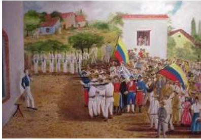
Fusilamiento de Piar, al lado de la catedral de Angostura

Un episodio muy triste fue el de Manuel Piar, quien había luchado por la independencia de Venezuela, al lado de los patriotas. Al sentirse desplazado por Bolívar, Piar empezó a conspirar.