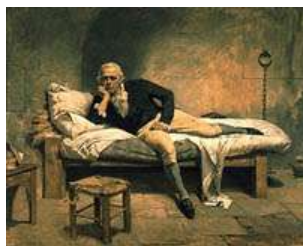
Miranda en la Carraca - Arturo Michelena

de Julio de 1816. También había muerto en forma prematura la Primera República.