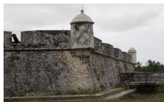
Fortín de San Felipe

En Puerto Cabello, un soldado traicionó a Simón Bolívar, sublevando parte de la guarnición. A pesar de eso Bolívar luchó desesperadamente para defender la plaza, hasta que tuvo que huir a La Guaira. En una carta a Miranda, escribió: "Si un solo soldado me hubiese quedado, con ese habría combatido al enemigo; si me abandonaron no fue por mi culpa. Nada me quedó que hacer para contenerlos y comprometerlos a que salvarsen la patria; pero, ¡ah! esta se ha perdido en mis manos.