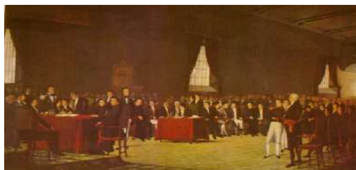
Firma de la Independencia por Tomás Lovera

El 5 de Julio de 1811, los miembros de la Sociedad Patriótica, convencieron a todos los congresantes menos uno, de declarar la independencia de Venezuela, olvidándose de una vez de la defensa de los derechos de Fernando VII. Esto marcó la fundación del Estado Venezolano. El acta de independencia fue encomendada a Juan Germán Roscio y el texto definitivo fue aprobado el 7 de julio. (Más detalles)