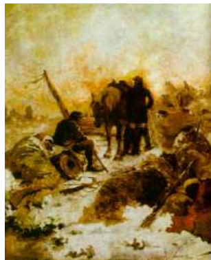
El paso de los Andes - Arturo Michelena

Después de instalado el nuevo congreso, y ya como presidente de Venezuela, Simón Bolívar decidió concretar su viejo sueño de unir a Nueva Granada y Venezuela. Es así como cruza los llanos de Apure y llega a la provincia de Casamare, en donde se une con Santander e inicia el Paso de los Andes, por el páramo de Pisba, toda una hazaña que le costó la vida de muchos patriotas. Sin embargo, el sacrificio no fue en vano, ya que sorprendió a los realistas, quienes no se esperaban la llegada por ese lugar.