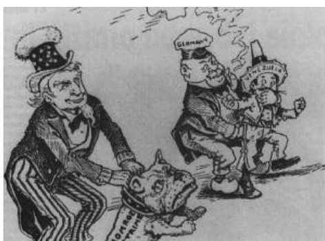
Venezuela rehén de las potencias extranjeras Caricatura de la época

El otro gran problema que tuvo que enfrentar Cipriano Castro, fue el bloqueo naval que impusieron Inglaterra y Alemania, ya que Venezuela se negaba a pagar su deuda, y había confiscado la empresa inglesa que suministraba electricidad a Caracas. Por su parte, Cipriano Castro se quejaba de las empresas extranjeras que habían intervenido en problemas nacionales, al suministrar dinero a los enemigos del gobierno.