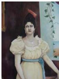
Luisa Cáceres de Arismendi

Morillo llegó a Pampatar el 9 de abril y logró deponer rápidamente a los jefes patriotas Bermúdez y Arismendi, quien logró escapar. Sin embargo, su esposa Luisa Cáceres fue capturada y encarcelada en un calabozo del castillo de Santa Rosa en La Asunción, en donde perdió el bebé que llevaba en su vientre.