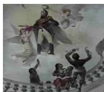
Liberación de los esclavos Techo Concejo Municipal Caracas

Viendo que no lograba su objetivo, Bolívar decide irse de Jamaica a Cartagena, pero en pleno viaje, se entera que Cartagena había caído en manos de Morillo, por lo cual se desvió al puerto de Los Cayos en Haití, llegando el 25 de diciembre de 1815. En esta isla consigue el apoyo del su presidente, Alejandro Petión y de Luis Brión, un curazoleño. De allí logró organizar una expedición llamada la "[primera] expedición de Los Cayos", la cual salió en marzo de 1816 y llegó a Margarita (que ya estaba nuevamente bajo el control de Arismendi) y a Carúpano. El 1° de junio, decretó la libertad de los esclavos que estuviesen dispuestos a pelear por los patriotas. De allí se dirige a Ocumare de la Costa, en donde ratifica el decreto de liberación de los esclavos y deja sin efecto el Decreto de guerra a muerte. Sin embargo, es vencido por las fuerzas realistas y debe huir a Bonaire y luego va a Oriente. Sin embargo, allí es desconocido por Mariño y Bermúdez y decide devolverse a Haití.