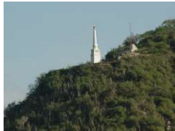
Matasiete: Monumento conmemorativo

El general realista La Torre se enfrenta a los patriotas, pero es derrotado el 11 de abril de 1817 en la batalla de San Félix. Simón Bolívar, con la división del general Bermúdez persigue a La Torre y lo obliga a pelearse con Luis Brión, quien lo vence en el encuentro naval del Orinoco. Esto completa la conquista de Guayana y le da a los patriotas una sede, en la ciudad de Angostura, con salida al exterior por el río Orinoco.