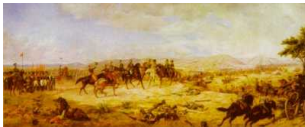
Batalla de Ayacucho - Martín Tovar y Tovar

en Ayacucho, batalla que marcó el fin de la dominación española en el continente. Bolívar escribió: "La batalla de Ayacucho es la cumbre de la gloria americana y la obra del General Sucre. La disposición de ella ha sido perfecta y su ejecución divina. Maniobras hábiles y prontas desbarataron en una hora a los vencedores en catorce años, y a un enemigo perfectamente constituido y hábilmente mandado. Ayacucho, semejante a Waterloo, que decidió el destino de la Europa, ha fijado la suerte de las naciones americanas".