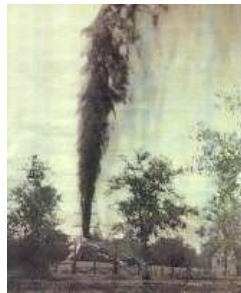
Reventón del Barroso No. 2

Es durante el período de Gómez que se inició la industria Petrolera Venezolana. Muchos trabajadores del campo emigraron hacia las zonas petroleras, en donde conseguían trabajo más fácilmente. Algunos de los aspectos positivos que tuvo este período fue precisamente el favorecimiento de las inversiones extranjeras (en particular en el sector petrolero que permitió a Venezuela el desarrollo petrolero que tiene hoy en día), y el pago de la deuda externa que agobiaba al país (aunque a un costo muy grande).