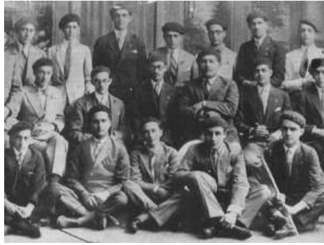
Generación del 28

Es durante el período de Gómez que se inició la industria Petrolera Venezolana. Muchos trabajadores del campo emigraron hacia las zonas petroleras, en donde conseguían trabajo más fácilmente. Algunos de los aspectos positivos que tuvo este período fue precisamente el favorecimiento de las inversiones extranjeras (en particular en el sector petrolero que permitió a Venezuela el desarrollo petrolero que tiene hoy en día), y el pago de la deuda externa que agobiaba al país (aunque a un costo muy grande).