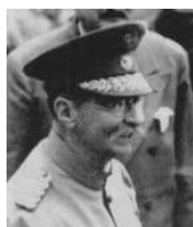
Juan Vicente Gómez

El conflicto fue resuelto gracias a la presión de la opinión pública en Francia, Inglaterra y Alemania, así como a la intervención del presidente de los Estados Unidos, Teodoro Roosevelt, quien intervino como mediador. Venezuela, por su parte, se comprometió a pagar su deuda y las naciones agresoras devolvieron los buques apresados y suspendieron el bloqueo.