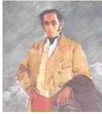
Bolívar en 1827

En septiembre de 1828, un grupo de radicales Santanderistas, dirigidos por Florentino González, trató de asesinar a Bolívar, pero fracasaron gracias a Manuela Sáenz, quien logró distraerlos mientras Simón Bolívar se escapaba por una ventana. En 1829 se efectuó en Valencia una Asamblea popular que decidió la separación definitiva de Venezuela de la República de Colombia, desconocer la autoridad de Bolívar y que nombró a Páez "Jefe Superior del País". También se nombró un congreso constituyente que se instaló en Valencia el 6 de mayo de 1830.