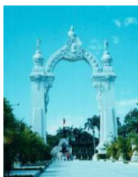
Monumento en conmemoración de la batalla de Carabobo

Es así como el 24 de junio de 1821 se desarrolla la batalla de Carabobo (Ver detalles), en donde el ejército comandado por Simón Bolívar, derrotó a Miguel de La Torre, consolidando la independencia de Venezuela.