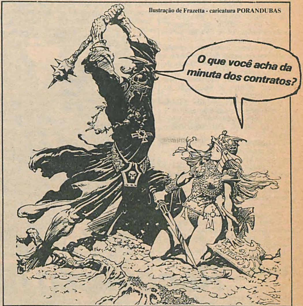
Ilustração de Frazetta - caricatura PORANDUBAS