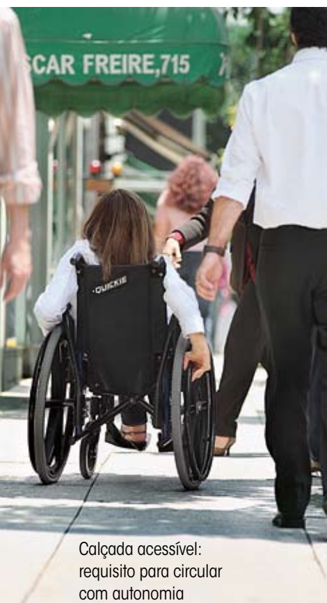
Calçada acessível: requisito para circular com autonomia

Para entender a pessoa que tem uma deficiência é preciso enxergar a pessoa, não a deficiência