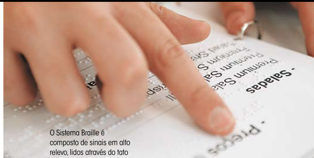
O Sistema Braille é composto de sinais em alto relevo, lidos através do tato

O computador é um importante aliado na comunicação de pessoas com cegueira, baixa visão e surdez. A melhoria dos recursos de acessibilidade – como sistemas de voz que leem as informações dos sites e correio eletrônico, e animações que traduzem o texto para a Libras, permitem ampliar a rede de relacionamento desses públicos. Assim como os celulares, já que surdos estão entre os principais usuários dos serviços de mensagens de texto.