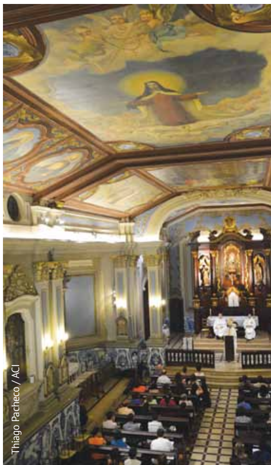
Thiago Pacheco / ACI

A Coordenadoria da Pastoral Universitária tem como objetivo auxiliar a comunidade universitária a articular de maneira adequada sua vida acadêmica, pessoal, social com a fé. Para tanto, promove orientação espiritual, retiros, preparação para os sacramentos, grupos de reflexão e debates sobre temas relacionados à Igreja Católica. A unidade também realiza campanhas de arrecadação de agasalhos, brinquedos e alimentos para a população carente. A Pastoral celebra missas periódicas nos campi Monte Alegre (foto), Consolação, Sorocaba e Barueri: confira datas e horários no site www.pucsp.br/pastoral . Na mesma página é possível conhecer as agendas de atendimento e plantão nos outros campi. O setor fica na sala 63 (térreo, prédio novo, campus Monte Alegre) e tem um Espaço de Convivência no mesmo pavimento. Informações: (11) 3670-8557 ou pastoralpuc@pucsp.br . (T. Pa.)