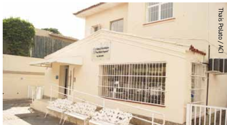
Thais Polato / ACI

A Clínica está localizada na rua Almirante Pereira Guimarães, 150 (Pacaembu). Mais informações: (11) 3862-6070 ou secretariacp@pucsp.br . Site: www.pucsp.br/clinica . (B. A.)