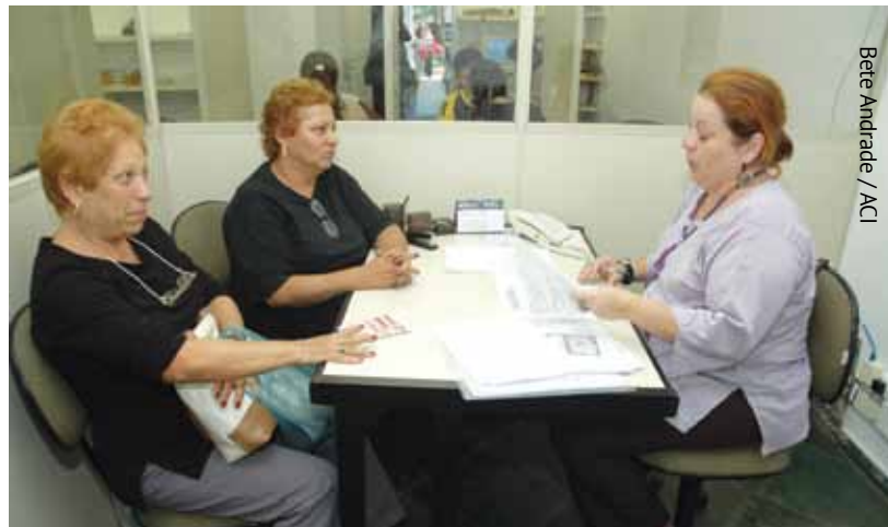
Bete Andrade / ACI

O Escritório Modelo fica na rua João Ramalho, 295 (Perdizes). Ao lado da unidade funciona o Juizado Especial Cível (JEC), parceria da PUC-SP com o Tribunal de Justiça de São Paulo. Informações: (11) 3873-3200 ou esc.modelo@pucsp.br . Site: http://escritoriomodelo.pucsp.br . (T. Pa.)