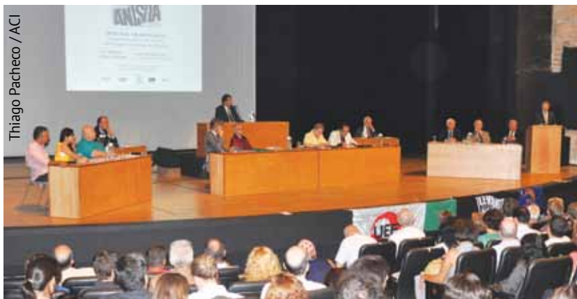
Thiago Pacheco / ACI

Alunos, professores e funcionários pagam apenas R$ 10 no ingresso para as peças. Mantenha-se atualizado sobre os espetáculos no site www.teatrotuca.com.br .