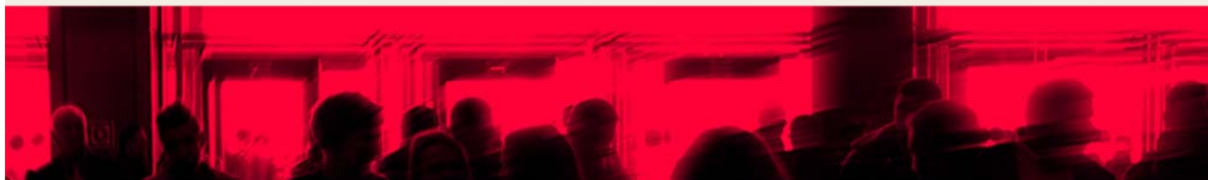
Tela da projeção realizada durante o III SIEP: Consumo.