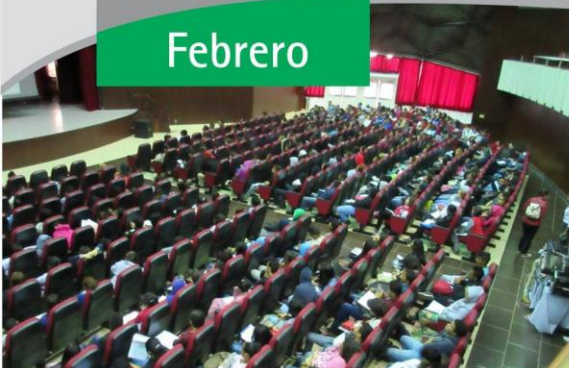
Charla sobre discapacidad a cargo de la Oficina de Equiparación de oportunidades, en el ingreso de la Universidad de Panamá/ Enero, 2016