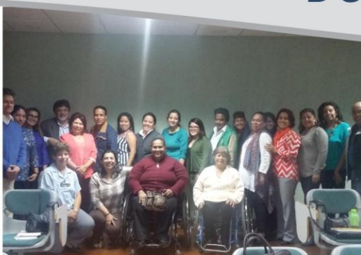
Apertura de la Maestría sobre Análisis Social de la Discapacidad en el Centro Universitario Metropolitano. Guatemala / Enero, 2016