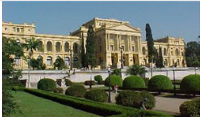
Museu Histórico do Ipiranga