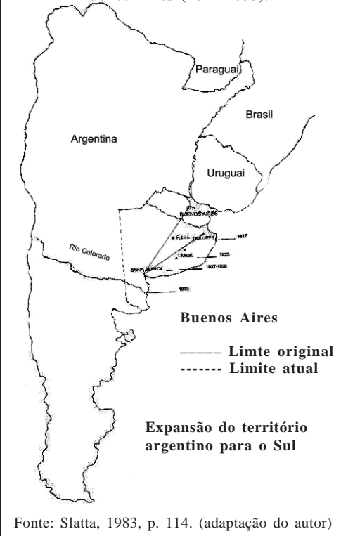
Mapa 2 – Expansão territorial da Província de Buenos Aires (1817-1833).

No final de 1832, o setor pecuarista sentia que necessitava de mais terras para expandir a produção. A pressão sobre novos campos se fizera constante desde os inícios da década anterior e aumentara consideravelmente com a grande seca e com a queda dos preços no mercado internacional que marcaram os inícios da década de 1830.