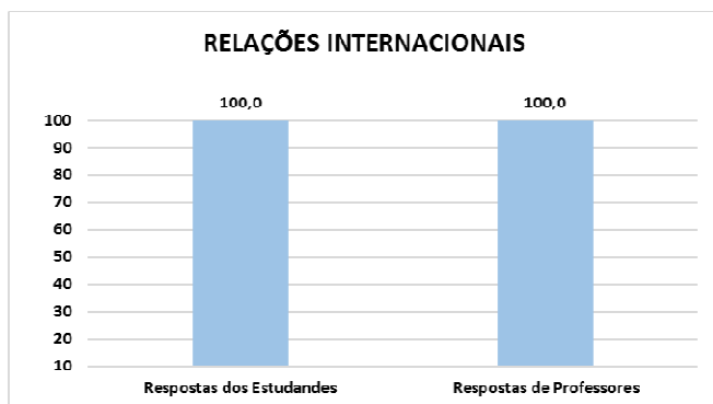
Gráfico1. Conhecimento Acadêmico