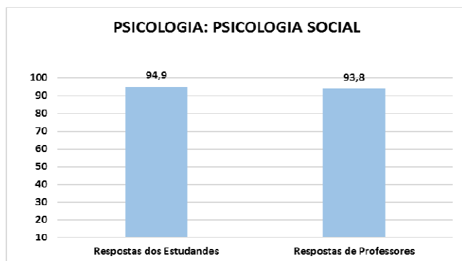
Gráfico1. Conhecimento Acadêmico