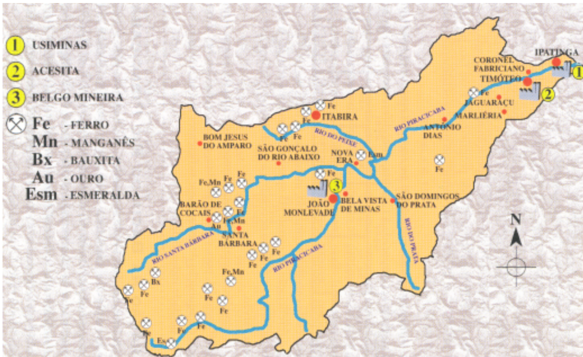
FIGURA 4.1 EVOLUÇÃO DO USO DA TERRA NA BACIA DO RIO PIRACICABA E SEU ENTORNO

LOCALIZAÇÃO E PRINCIPAIS ATIVIDADES MÍNERO-SIDERÚRGICAS NA BACIA DO RIO PIRACICABA